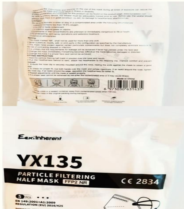
IMMAGINE BUSTA INTERNA A SCATOLA CONTENENTE N. 5 FILTRANTI FACCIALI FFP2 YX135