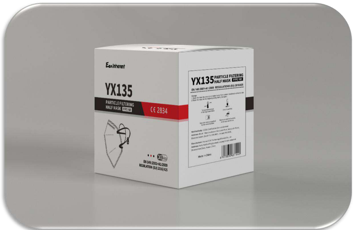
Immagine scatola da 30 Pz. In buste da 5Pz.

Importatore: Never Land d.o.o. Trg. Slobode 4 52460 Buje – Croatia